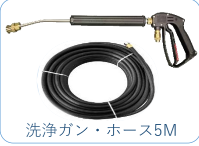
洗浄ガン・ホース5M