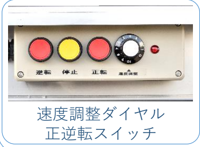
速度調整ダイヤル 正逆転スイッチ